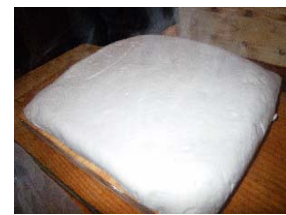
できたての豆腐・・・大きい!