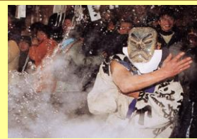
千と千尋の舞台 遠山郷霜月祭