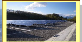
メガワットソーラー (環境ツアーの一環)