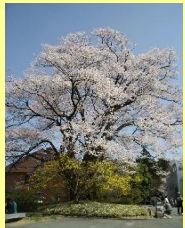
当地随一の安富桜