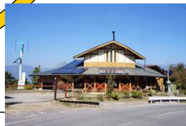
宿泊、交流拠点 風の学舎