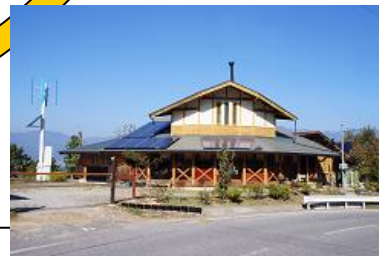
宿泊、交流拠点 風の学舎